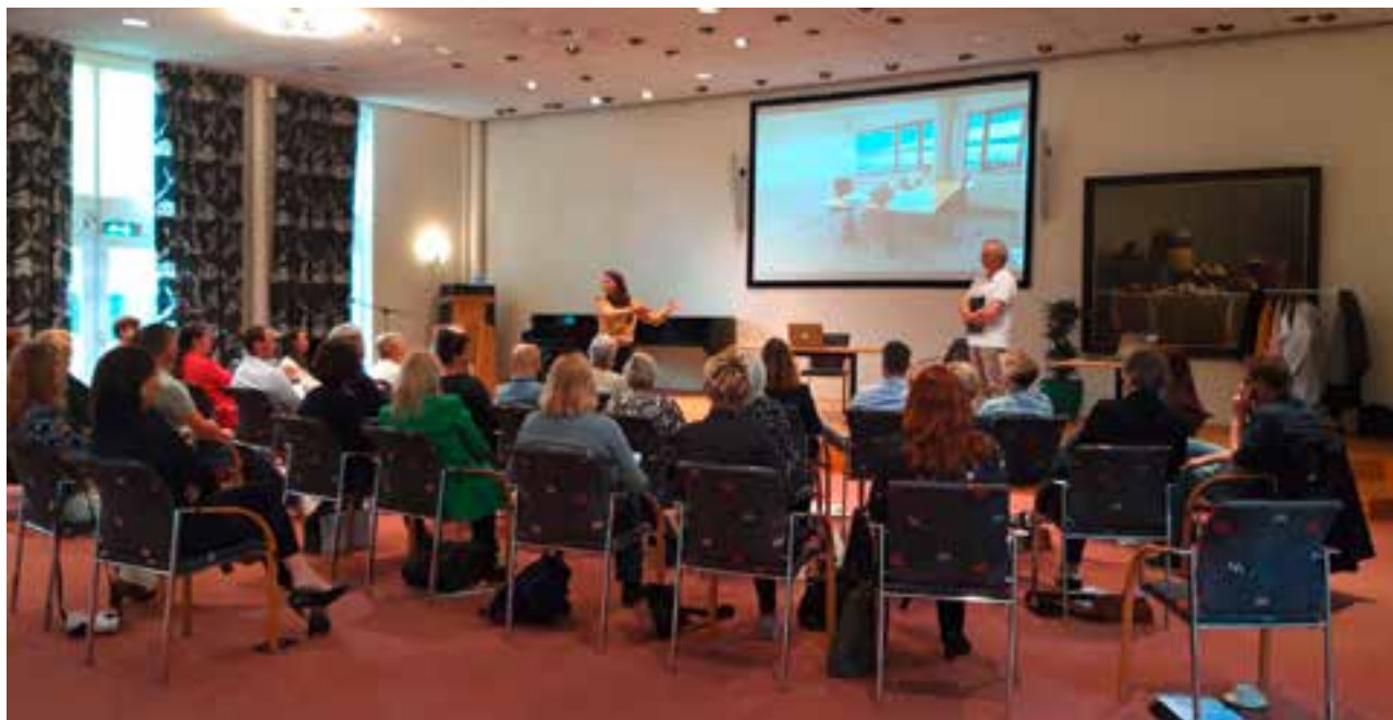
WHAPA Leidinggevendendag: Herkenbaar en ludiek: Praktijksituaties worden besproken en nagespeeld tijdens Leidinggevendendag

gebouwd aan een landelijk netwerk waarvoor éénmaal per jaar een bijeenkomst wordt georganiseerd met actuele thema's. Daarbij gaan leidinggevenden met elkaar in gesprek en wisselen ze ervaringen uit. Tijdens deze bijeenkomst zullen zij door één of meerdere professionals handvaten aangereikt krijgen om zijn of haar team nog beter aan te kunnen sturen en te managen.